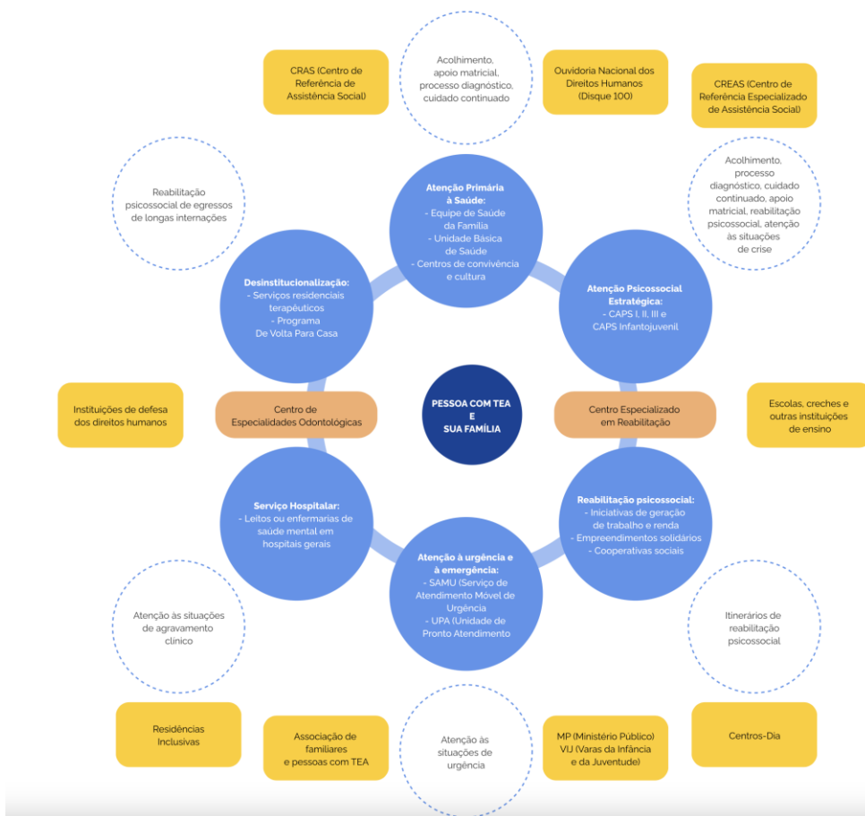
Rede de Cuidados à Saúde da Pessoa com TEA

elaboração do Projeto Terapêutico Singular (PTS).