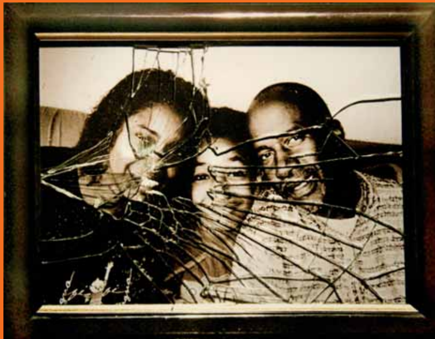
■ “Essa pedra despedaça famílias” é uma das fotos da campanha Crack Destrói